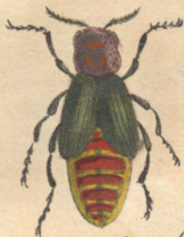
Meloe maiialis /Fabr.

Der eigentliche Mairwurmkäfer. Der vergoldete Mairwurm.