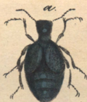
Meloe punctalata /Fabr.