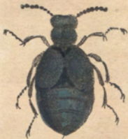
Meloe brevicollis / Helln. Der Mainwurmkäfer mit dem kurzen Bruststücke.