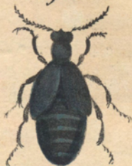
Meloe proscorobaeus /Fabr.