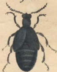
Meloe proscorobaeus /Fabr.