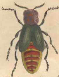
Meloe maiialis /Fabr.

Der eigentliche Maimurmkäfer. Der vergoldete Maimurm.