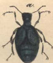
Meloe punctulata /Fabr.