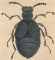
Meloe brevicollis / Helln. Der Mainwurmkäfer mit dem kurzen Bruststücke.