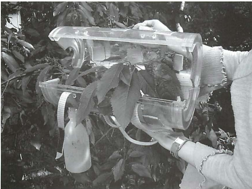
Abb. 2 Sammelrohr, zur Beprobung eines Zweiges aufgeklappt