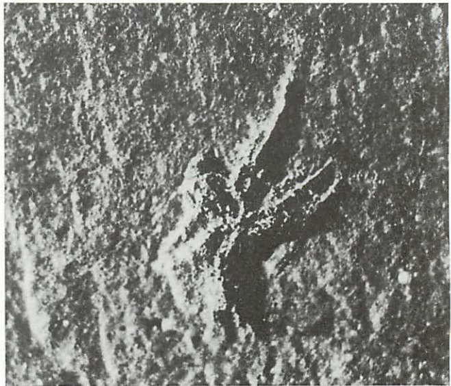
Abb. 4 Amorphognathus pietzschii Müller & Walliser, 1962 (Foto des in Abb. 3, Fig. 3 und 4 dargestellten Conodonten), Eichberg bei Weißig, Oberes Valent