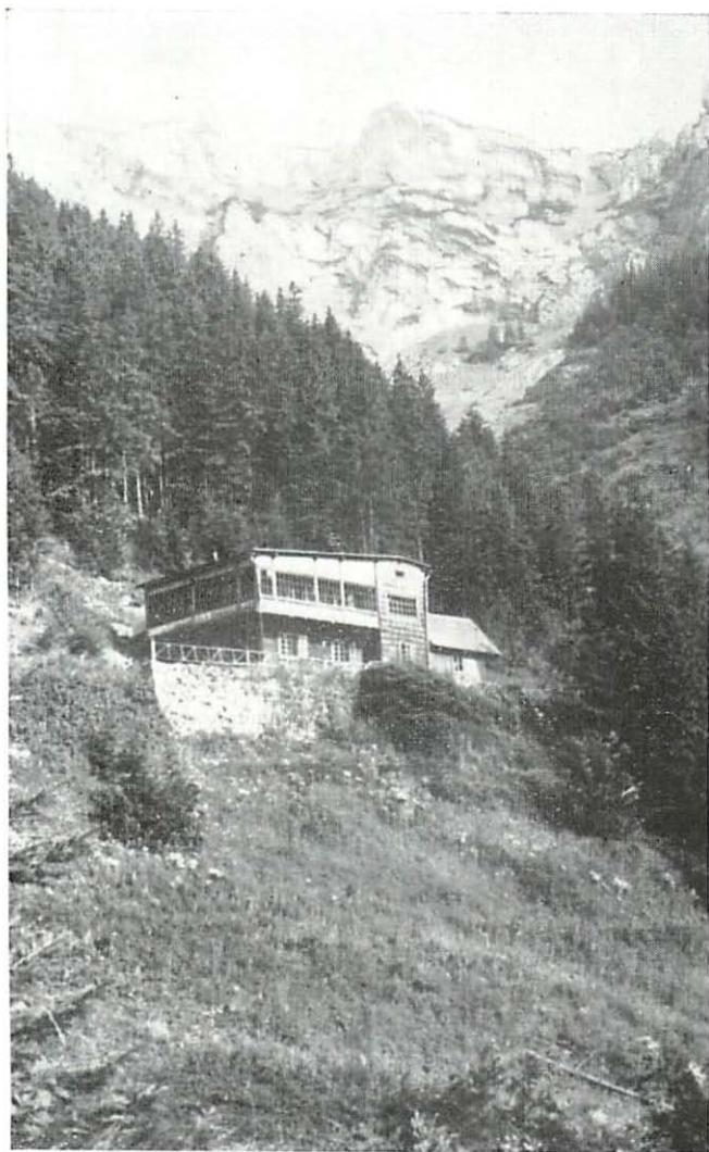
Abb. 2. Aufnahme der Hviezdoň-Hütte in Belanské Tatry.